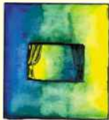
KAAS & KAPPES

Das Festival KAAS & KAPPES nutzt kontinuierlich die Grenz- nähe zu unseren benachbarten Niederlanden zu einem frucht- baren Austausch.