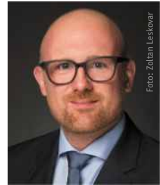
Sören Link Oberbürgermeister