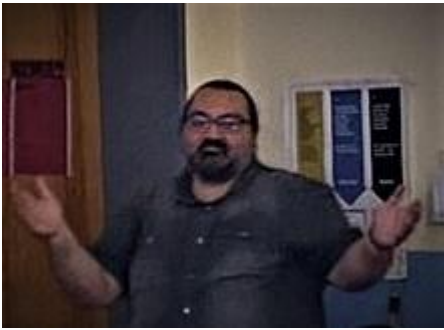
Die Künstler*innen: Cem Arslan (+)