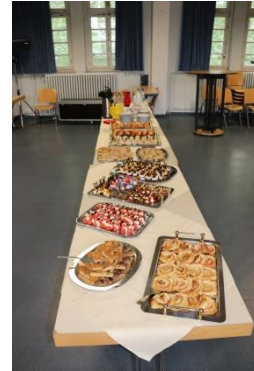
Pilotprojekt-Abschlussveranstaltung in der Aula