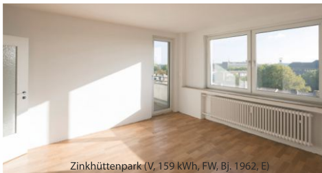
Zinkhüttenpark (V, 159 kWh, FW, Bj. 1962, E)

Rufen Sie uns an oder schreiben Sie uns eine E-Mail. Gerne vereinbaren wir einen individuellen Beratungstermin mit Ihnen in unserem Vermietungsbüro vor Ort.